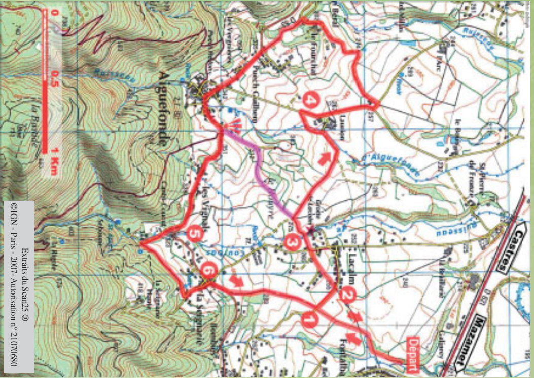
Extrats du Scand5 © ©IGN - Paris - 2007 - Autorisation n° 21070680